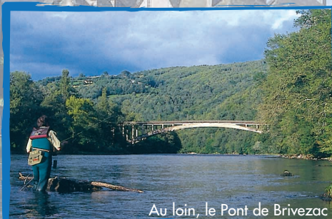
Au loin, le Pont de Brivezac