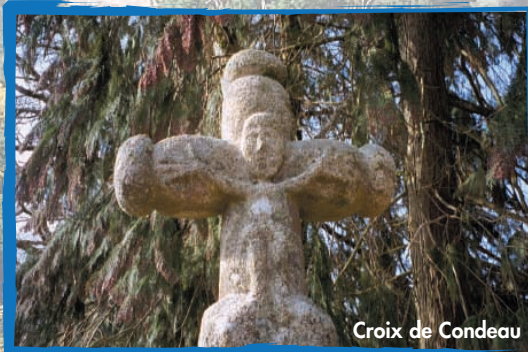
Croix de Condeau