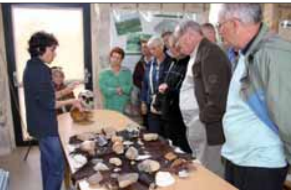
On vient de loin au Musée pour découvrir l'histoire de l'Homme de Néandertal.

Le 3 août 1908, grâce à la perspicacité des frères Bouyssonie, le village de La Chapelle-aux-Saints entre dans l'histoire. La découverte du squelette d'un homme de Néandertal, vieux de 45.000 ans, aura un retentissement considérable dans le monde. Le 3 août prochain, à l'occasion du centenaire, cet homme de Néandertal revient exceptionnellement en Corrèze.