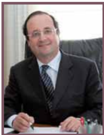
François Hollande, Président du Conseil Général de la Corrèze