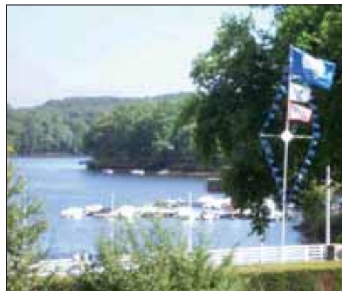
Le lac de Neuvic hisse le drapeau du Pavillon bleu.