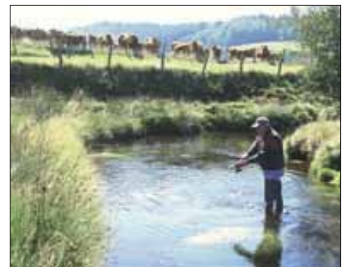
Un lieu privilégié pour la pêche à la truite.

Fréquenté par la discrète loutre, par la sauvage fario, par le rapide circaète Jean-le-Blanc (un des plus grands rapaces diurnes du secteur) et par quelques papillons rares qui tourbillonnent de haie en haie, le territoire se révèle aussi comme le paradis des espèces végétales. A l'ombre des landes survolées par la pie grièche grise, la gentiane jaune donne aux lieux une tonalité déjà montagnarde. Les tourbières, qui abriteraient, dit-on, feux follets et lutins, accueillent aussi la droséra, une plante carnivore protégée, qui piège les naïfs insectes grâce à ses gouttes de suc digestif qu'elle sécrète le long de ses feuilles.