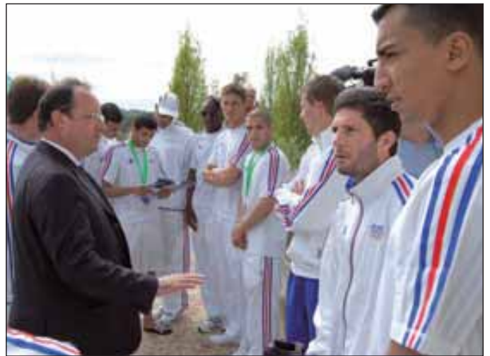
L'équipe de France olympique de boxe a été chaleureusement encouragée par François Hollande.

Du 4 au 17 juillet, le centre sportif de Bugeat accueille l'équipe de France olympique de boxe pour un dernier stage de préparation avant les J.O. de Pékin. Les équipes d'Allemagne, d'Angleterre, d'Irlande, de Grèce, de Bulgarie et de Suède sont aussi sur les rangs et sur les rings de Bugeat.