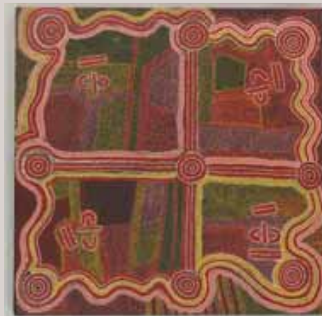
Rêve des deux hommes - Peinture acrylique sur toile Musée du quai Branly, Paris.

E n moins d'une décennie, le Domaine de Sédières s'est imposé comme le lieu central de la période estivale en Corrèze. Dans un cadre à la fois naturel et chargé d'histoire, les artistes peintres, chorégraphes, acteurs, musiciens et chanteurs se succèdent chaque année durant les deux mois d'été. Cette année encore, "Un été à Sédières", produit par le Conseil Général et réalisé par l'ADIAM 19, propose un programme éclectique fait de chansons, musique, spectacles en création et exposition, sans oublier les activités de pleine nature.