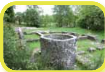
Les Ruines des Cars à Saint-Merd-les-Oussines.

La légende garde l'histoire de cette bergère et de son troupeau de vaches pacageant sur la tourbière du Longeyroux et pétrifiées suite à un terrible orage. La pastourelle, venant implorer le diable, vit ses vaches se transformer une à une en pierres et la lande se recouvrir de mille pierres ou "Millevaches". Y aurait-il 1.000 vaches sur le plateau ? Pas vraiment. Mais plutôt 1.000 sources, comme l'indique l'étymologie du nom qui renvoie à mille "vacca" (mille sources) ce qui prouve que ce territoire est bien le château d'eau de la région.