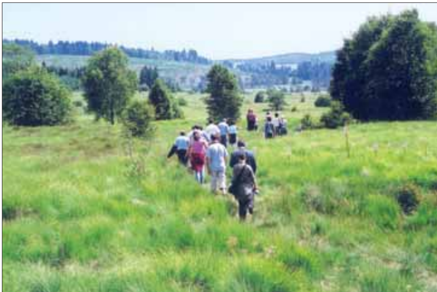
A la découverte des Tourbières du Longeyroux.

Sur les contreforts du Massif Central, le Parc naturel régional de Millevaches se singularise par les paysages typiques de la montagne limousine : tourbières, landes et forêts parcourus par une multitude de ruisseaux aux eaux vives et par de nombreux chemins creux. Une nature préservée, servie sur un plateau.