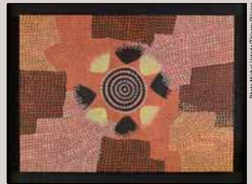
Rêve de Yala, igname sauvage - Peinture acrylique sur toile. Musée du quai Branly, Paris.