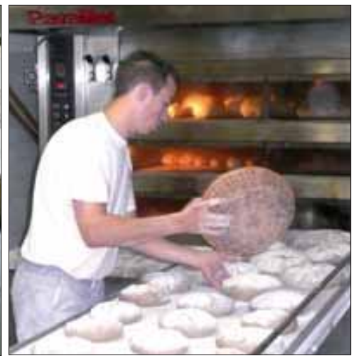
Le PNR de Millevaches soutient aussi le développement économique, qui passe d'abord par les aides au maintien des artisans.

L'un des grands objectifs du PNR est de gagner de nouveaux habitants. Nous sommes dans un élan de reconquête