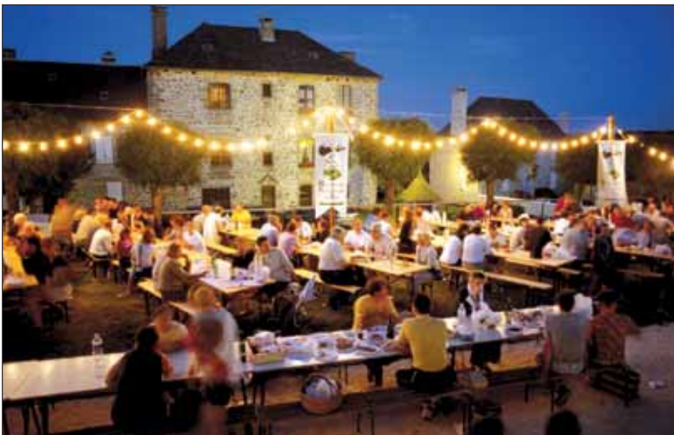
Sous un ciel étoilé, les marchés des producteurs de pays se poursuivent tard dans la soirée. Ici dans le village de Sainte-Féréole.

Après Sédières en guise de copieux hors-d'œuvre le 22 juin, la nouvelle saison des marchés des producteurs de pays débute tambour battant en ce mois de juillet dans une quinzaine de communes de la Corrèze. Si le succès de ces rendez-vous hebdomadaires n'est plus à démontrer, plusieurs nouveautés ponctueront ces deux mois d'été.