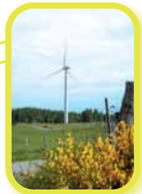
Les éoliennes de Peyrelevade.