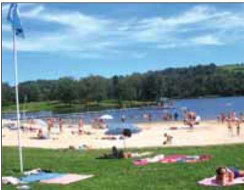
L'étang de Miel a vu sa fréquentation augmenter depuis l'obtention du Pavillon bleu.

Une nouvelle fois, les deux communes corréziennes s'illustrent par la qualité de leurs eaux de baignade. Cet été, le Pavillon bleu continuera à flotter sur les plages des lacs de Miel et de Neuvic. Un palmarès 2008 qui, cette année, a récompensé 242 plages de l'Hexagone.