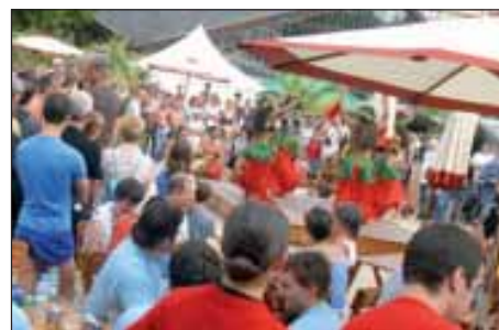
Brive plage 2007.

Conseil Général à l'opération Brive-Plage 2008), celui de Corrèze, celui du Pays de Pompadour et celui de la Région d'Ussel. ●