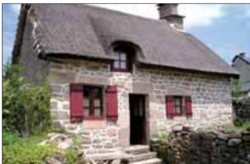
Dans le bourg de Millevaches, une maison typique du plateau, couverte en chaume.

Dans l'esprit des profanes, la vocation d'un Parc réside uniquement dans des actions de protection de la nature. En réalité, la Charte du PNR, document fondamental de cette entité, nous renvoie vers des compétences plus vastes et des domaines plus larges. L'éventail des missions du Parc naturel régional se concrétise sur le terrain par une kyrielle d'aides proposées aux habitants, premiers acteurs du développement. Ainsi, les résidents sont accompagnés dans la revitalisation rurale de leur habitat, les propriétaires dans la restructuration des parcelles boisées, les éleveurs dans la valorisation de la viande comme celle de l'agneau du plateau de Millevaches... Quelques exemples qui prouvent que le Parc a aussi une vocation économique.