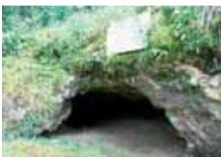
La grotte de la Bouffia Bonneval où les frères Bouyssonie ont découvert le célèbre squelette en 1908.